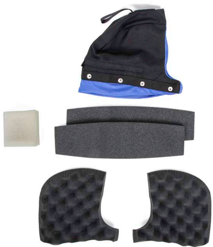
Componentes de la almohadilla para la cabeza

Existen varias maneras de rellenar con espuma la almohadilla para la cabeza. Puede disponer la espuma incluida en diferentes combinaciones y recortarla para que se adapte al encaje que necesite. Estos pasos solo se incluyen a modo de ayuda y orientación.