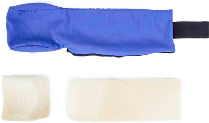
Componentes del separador de espuma de la almohadilla para la cabeza (SEAC)