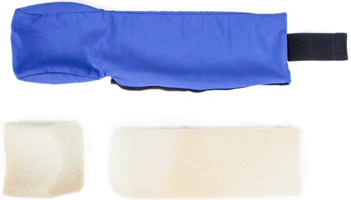
Componentes del separador de espuma de la almohadilla para la cabeza (SEAC)

la almohadilla para la cabeza. El separador ayuda a posicionar adecuadamente las partes superior y trasera de la cabeza en el casco: la parte más grande del separador se ubica en la zona inferior del cuello y lleva la cabeza hacia adelante, de manera que la nariz y la boca se introduzcan en la máscara buconasal.