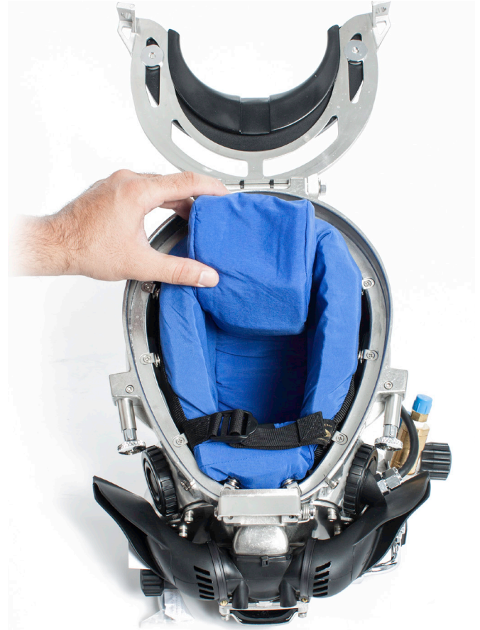
Sostenga el SEAC contra la parte trasera del casco durante la colocación.