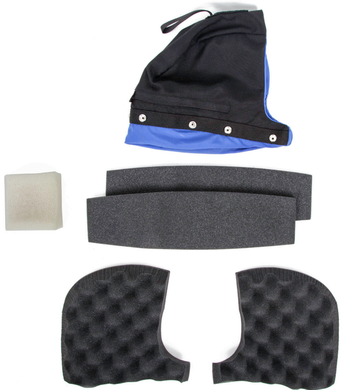
Componentes de la almohadilla para la cabeza

Existen varias maneras de rellenar con espuma la almohadilla para la cabeza. Puede disponer la espuma incluida en diferentes combinaciones y recortarla para que se adapte al encaje que necesite. Estos pasos solo se incluyen a modo de ayuda y orientación.