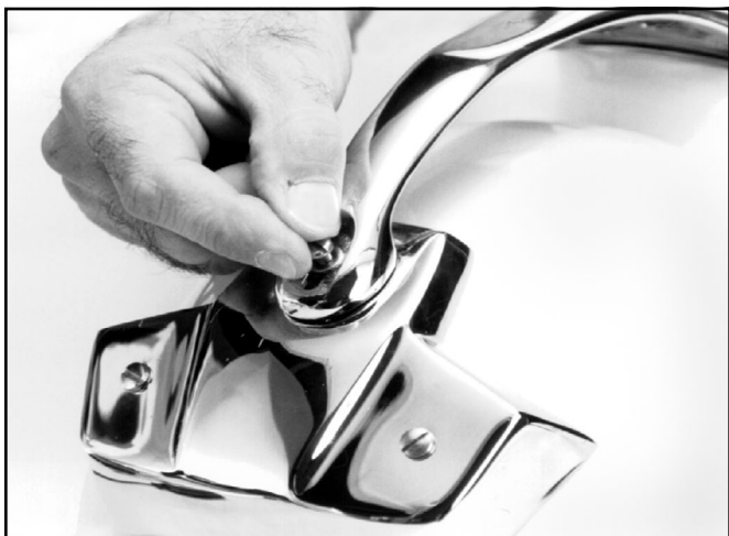
Retire el tornillo de la parte trasera de la agarradera.

2) Quite el tornillo y la arandela que sujetan la parte trasera de la agarradera.