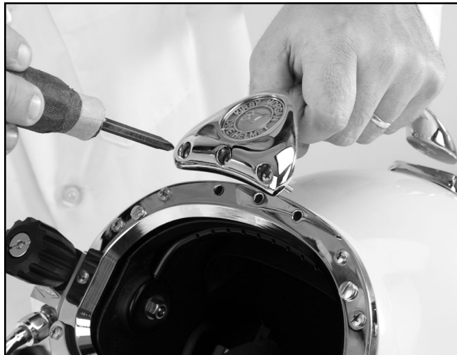
Apoye la agarradera en el casco.

1) Apoye la agarradera en el casco y enrosque los tornillos delanteros hasta que estén firmes, pero sin ajustar demasiado.