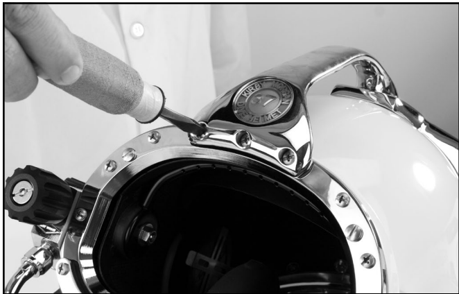
Desatornille los tres tornillos superiores del marco de retención del visor.

2) Quite el tornillo y la arandela que sujetan la parte trasera de la agarradera.