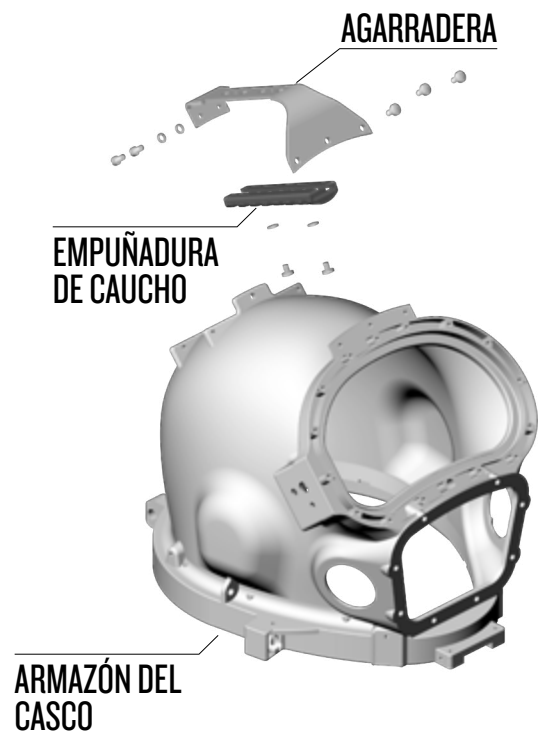
Vista despiezada de la agarradera y el armazón del casco

1) Para quitar la agarradera, primero desatornille los tres tornillos delanteros que le corresponden.