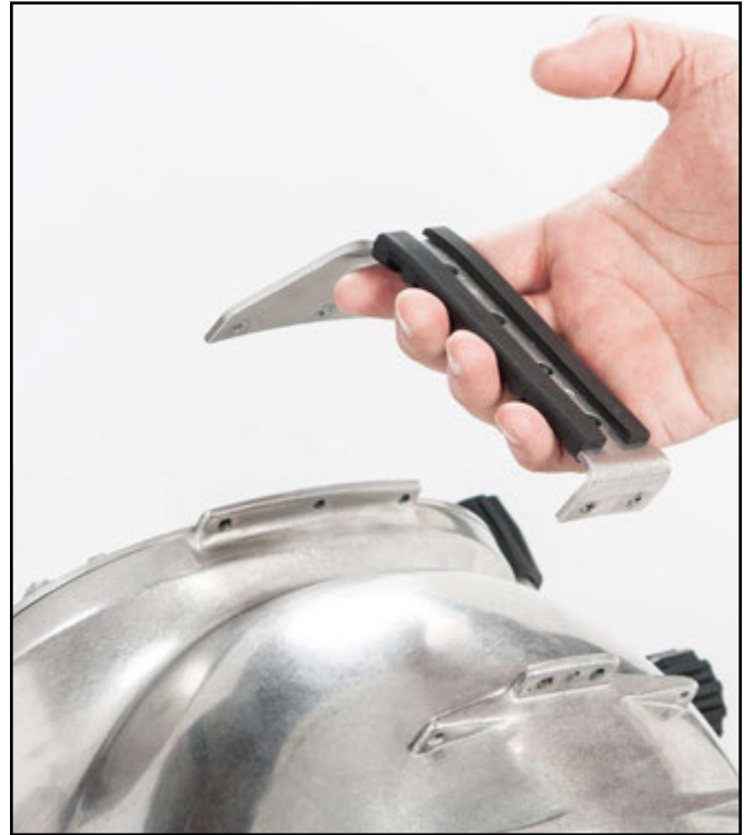
La agarradera puede colocarse fácilmente.