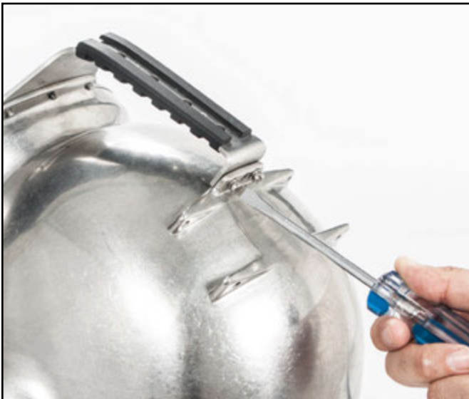
Retire los tornillos de la parte trasera de la agarradera.

2) Quite los tornillos y las arandelas que sujetan la parte trasera de la agarradera. Una vez que haya hecho esto, puede retirar la agarradera.